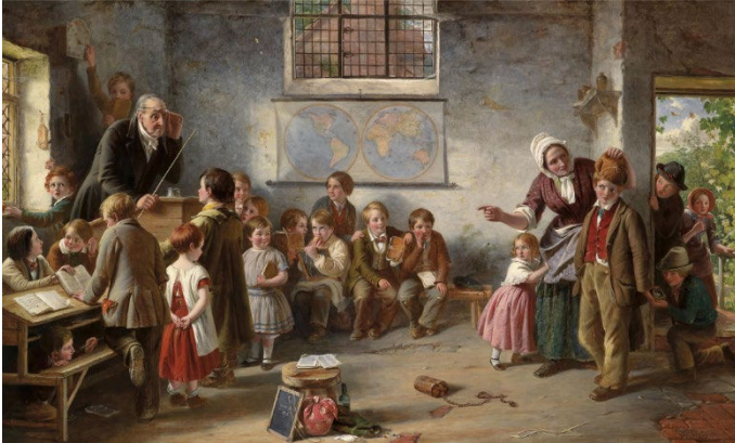
Thomas Brooks. O aluno novo (1854).